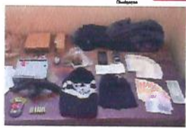
REVÓLVER , drogas e duas toucas foram apreendidos

Adolescente de 17 anos foi apreendido, depois que policiais encontraram em sua casa um revólver calibre 38, drogas, duas toucas bala-clava, uma peruca loura, objetos com procedência duvidosa, dinheiro e anotações referentes a comercialização de entorpecente. Ele foi encaminhado à delegacia junto com o material. A apreensão aconteceu após denúncia anônima. página 4