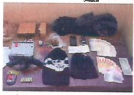
REVÓLVER, drogas e duas toucas foram apreendidos

Adolescente de 17 anos foi apreendido, depois que policiais encontraram em sua casa um revólver calibre 38, drogas, duas toucas bala-clava, uma peruca loura, objetos com procedência duvidosa, dinheiro e anotações referentes a comercialização de entorpecente. Ele foi encaminhado à delegacia junto com o material. A apreensão aconteceu após denúncia anônima. página 4