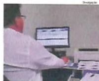
50 COMPUTADORES viabilizaram a integração

de R$ 0,15 corresponde a uma solicitação feita pela empresa Viação Cidade de Castro, durante o processo de licitação, no ano de 2012. página 5