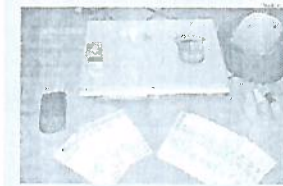
Materiais foram encaminhados à delegacia

O acusado disse que há pouco tempo está comercializando drogas na região da Boa Vista, e que paga o entropente com um indivíduo conhecido por "Bó". Este faz a entrega em um veículo gol, cor preta. O preso ainda informou que a porção de crack é vendida por R$10. Em relação aos objetos, ele informou que teria recebido um lote do repasse de drogas.