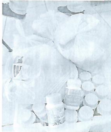
Medicamentos eram prescritos para todos os fins, desde depressão a problemas circulatorios

Quando chegaram no local, muitas pessoas esperavam