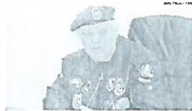
Delegado responsável pela investigação dos crimes

Nisto o irmão pegou uma arma, que estava no carro, disparou dois tiros contra a vítima e foi embora. A prisão preventiva contra os dois já foi efetuada.