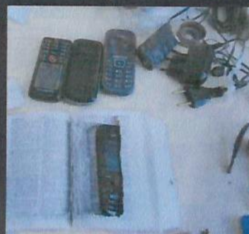
DETENTOS mostram criatividade na hora de esconder objetos. Celular foi encontrado no meio da Bíblia

Pente fino realizado na carceragem de Castro resultou na apreensão de diversos objetos entre tesoura, cola, pedaço de grade, celulares, carregadores entre outros. A operação aconteceu na manhã de ontem (17) pela Polícia Civil, com apoio da Polícia Militar, agentes do