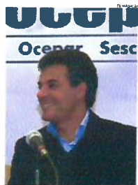
BETO NICHEIA investimento consolidado

Com forte apoio do Governo do Estado, as cooperativas paranaenses ignoram o ritmo lento da economia brasileira e projetam receita de R$ 42 bilhões em 2014 – 10% a mais dos R$ 38 bilhões faturados em 2013. O apoio se dá através de investimentos estaduais, em transporte e logística e, especialmente, com o programa Paraná Competitivo e com as linhas de crédito do BRDE (Banco Regional do Desenvolvimento do Extremo Sul). página 3