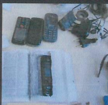
DEFENDIDOS mostram criatividade na hora de esconder objetos. Celular foi encontrado no meio da Bíblia

Pente fino realizado na carceragem de Castro resultou na apreensão de diversos objetos entre tesoura, cola, pedaço de grade, celulares, carregadores entre outros. A operação aconteceu na manhã de ontem (17) pela Polícia Civil, com apoio da Polícia Militar, agentes do