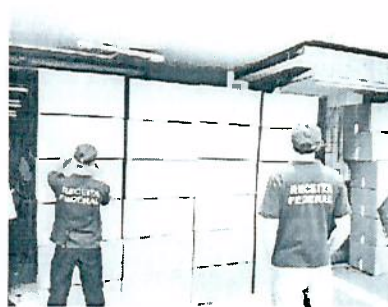
SEIS lojas foram fiscalizadas

Seis lojas localizadas na região central de Castro foram fiscalizadas e diversas mercadorias apreendidas, totalizando R$50 mil em produtos importados. As maiores apreensões foram de artigos de informática, eletrônicos, roupas, brinquedos, relógios e