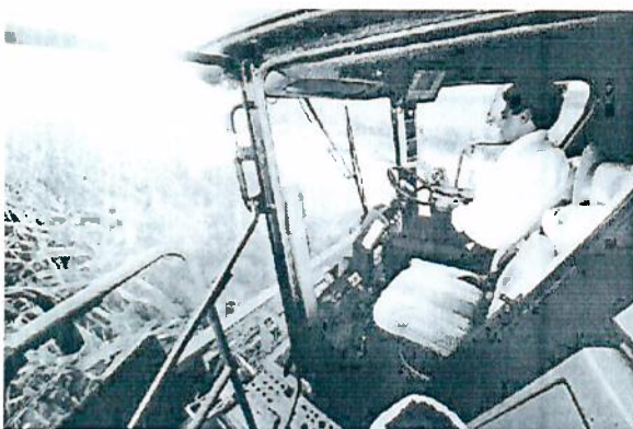
BETO RICHHA dirige uma das colheadeiras

A colheita da safra de milho 2013/2014, estimada em 15,7 milhões de toneladas no Paraná, já começou. Na quinta-feira (20), o governador Beto Richa, o prefeito Reinaldo Cardoso, o vice-prefeito Marcos Bertolini, en-