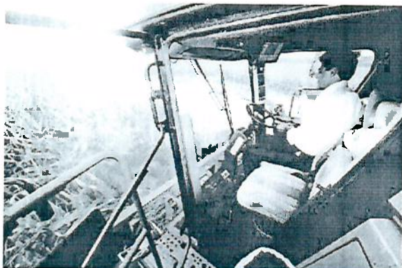
BETO RICHA dirige uma das colhedoras

A colheita da safra de milho 2013/2014, estimada em 15,7 milhões de toneladas no Paraná, já começou. Na quinta-feira (20), o governador Beto Richa, o prefeito Reinaldo Cardoso, o vice-prefeito Marcos Bertolini, entre