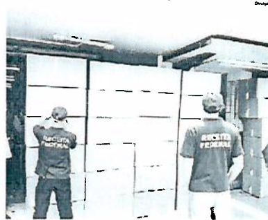
5 PFIS lojas foram fiscalizadas

Seis lojas localizadas na região central de Castro foram fiscalizadas e diversas mercadorias apreendidas, totalizando R$50 mil em produtos importados. As maiores apreensões foram de artigos de informática, eletrônicos, roupas, brinquedos, relógios e óculos. Foram 98 caixas destas mercadorias, porque os comerciantes não possuem comprovação da entrada regular da mercadoria no país. A operação mobilizou 9 funcionários da Receita entre servidores e equipes de apoio.