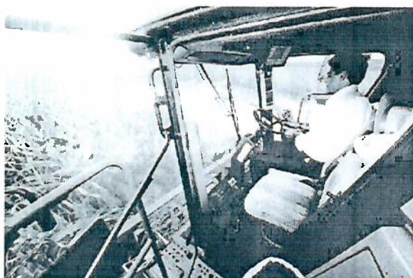
BETO RICHADirige uma das colheadeiras

A colheita da safra de milho 2013/2014, estimada em 15,7 milhões de toneladas no Paraná, já começou. Na quinta-feira (20), o governador Beto Richa, o prefeito Reinaldo Cardoso, o vice-prefeito Marcos Bertolini, entre