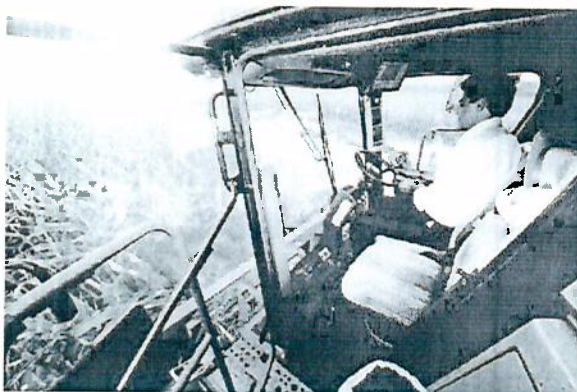
BETO RICHAdirige uma das colheadeiras

A colheita da safra de milho 2013/2014, estimada em 15,7 milhões de toneladas no Paraná, já começou. Na quinta-feira (20), o governador Beto Richa, o prefeito Reinaldo Cardoso, o vice-prefeito Marcos Bertolini, en-