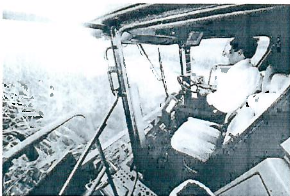
BETO RICHA dirige uma das colhedeiças

A colheita da safra de milho 2013/2014, estimada em 15,7 milhões de toneladas no Paraná, já começou. Na quinta-feira (20), o governador Beto Richa, o prefeito Reinaldo Cardoso, o vice-prefeito Marcos Bertolini, en-