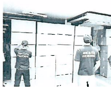
SEIS lojas foram fiscalizadas

Seis lojas localizadas na região central de Castro foram fiscalizadas e diversas mercadorias apreendidas, totalizando R$50 mil em produtos importados. As maiores apreensões foram de artigos de informática, eletrônicos, roupas, brinquedos, relógios e