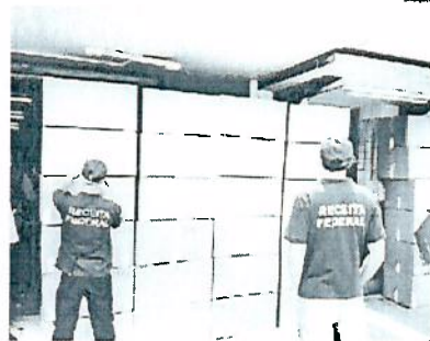
SEIS lojas foram fiscalizadas

Seis lojas localizadas na região central de Castro foram fiscalizadas e diversas mercadorias apreendidas, totalizando R$50 mil em produtos importados. As maiores apreensões foram de artigos de informática, eletrônicos, roupas, brinquedos, relógios e