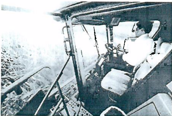
BETO RICHÁ dirige uma das colheadeiras

A colheita da safra de milho 2013/2014, estimada em 15,7 milhões de toneladas no Paraná, já começou. Na quinta-feira (20), o governador Beto Richa, o prefeito Reinaldo Cardoso, o vice-prefeito Marcos Bertolini, en-