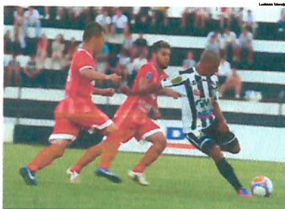
VITÓRIA pode garantir a liderança do Campeonato