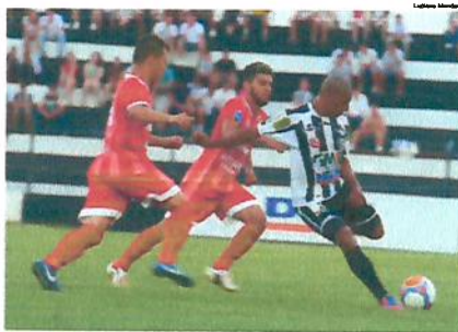
VITÓRIA pode garantir a liderança do Campeonato