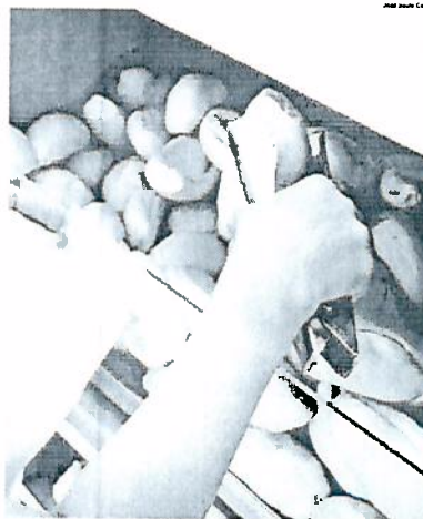
PORTARIA de 2006 do Inmetro determina a venda do pão francês por quilo

Oito anos após a regulamentação da Portaria do Inmetro (Instituto Nacional de Metrologia, Normalização e Qualidade Industrial), que determina a venda do pão francês por quilo, alguns estabelecimentos do Município ainda comercializam o produto por unidade. A prática pode ser arriscada tanto para comerciantes como para consumidores e a multa aplicada a estabelecimentos que a executam pode chegar a R$ 10 mil.