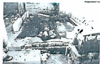
onde a jovem foi incinerada

Um caso ocorrido na quinta-feira acabou gerando confusão em Telêmaco Borba. Uma jovem foi morta carbonizada e o seu irmão teria a reconhecido. No entanto, durante esta sexta-feira, outro irmão procurou a delegacia de polícia para informar que houve um engano. A suposta vítima estava internada no hospital, devido a complicações na gravidez. O corpo, que já estava em Telêmaco, retornou ao IML de Ponta Grossa e aguarda identificação.