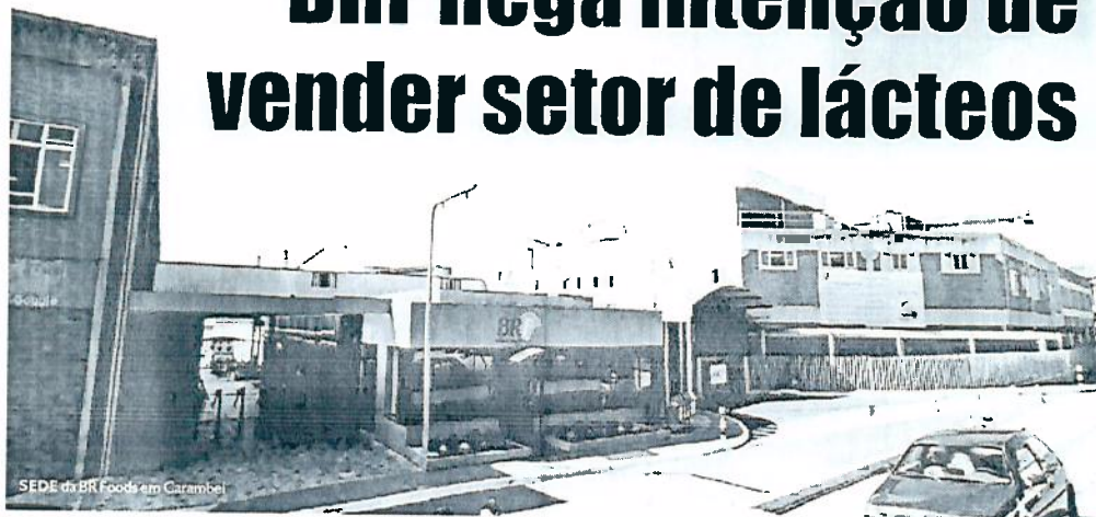
SEDE da BRF Foods em Carambei