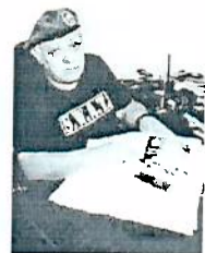
BR diz que médico deve ser preso

NEGLIGÊNCIA? Médico pode ser preso nos próximos dias