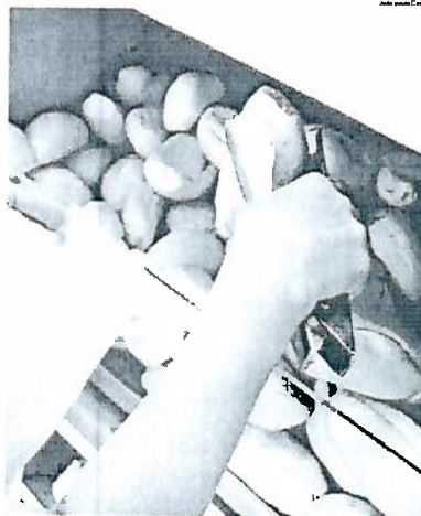
Portaria de 2006 do Inmetro determina a venda do pão francês por quilo

Oito anos após a regulamentação da Portaria do Inmetro (Instituto Nacional de Metrologia, Normalização e Qualidade Industrial), que determina a venda do pão francês por quilo, alguns estabelecimentos do Município ain-