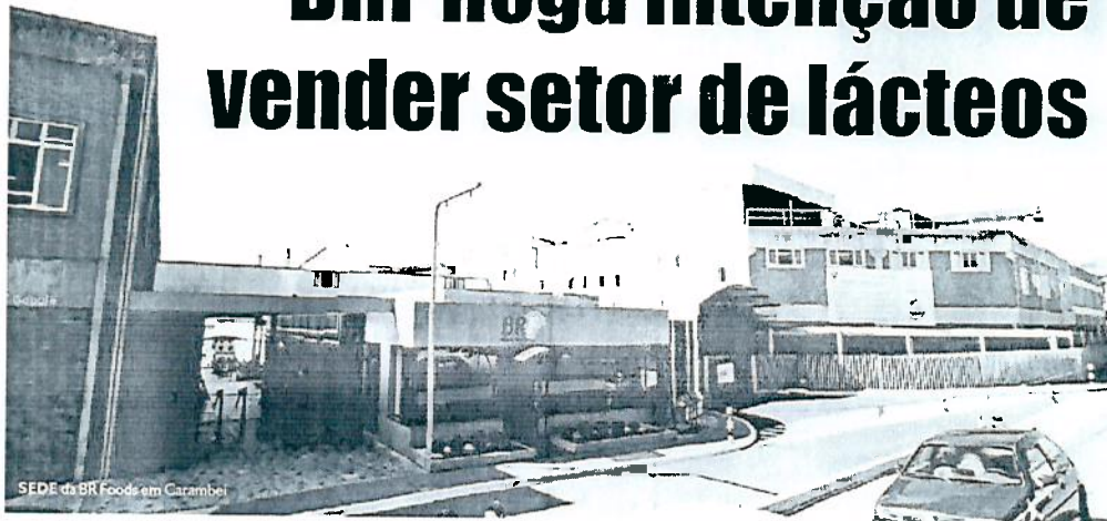
SEDE da BRF Foods em Carambei