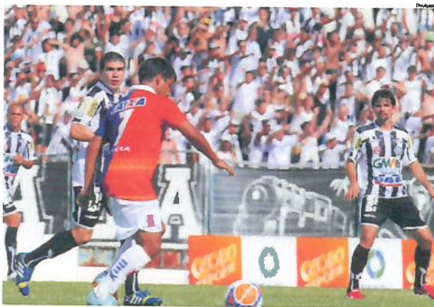
Paraná atropela o Fantasma que perde a primeira no Paranaense

A partida contra o Paraná Clube foi no domingo (9), às 17 horas. O Operário jogou em casa, no Estádio Germano Krüger, e até criou boas chances com o placar zerado, mas com o gol do adversário passou a errar jogadas e