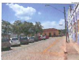
ESTACIONAMENTO muda no entorno da Praça Sant'Ana

A Secretaria Municipal de Segurança Pública adota mudanças no estacionamento no entorno da praça Sant'Ana. As mudanças foram motivadas, principalmente, devido à transferência do acervo do Museu do Tropeiro para imóvel na praça conhecido como Casa de Mariinha. Agora, em frente ao colégio e à Casa de Mariinha, a rua ganhou estacionamento paralelo. E, no entorno da praça o estacionamento continua em diagonal. — página 4