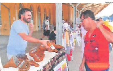
Além de artesanato, obras de artistas plásticos