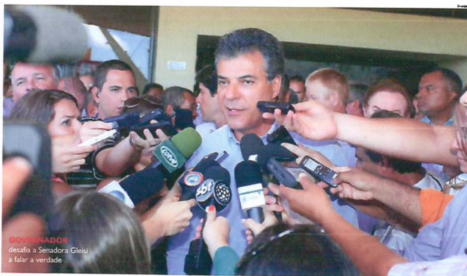
GOVERNADOR desafia a Senadora Gleisi a falar a verdade

O governador Beto Richa (PSDB) desafiou a senadora Gleisi Hoffmann (PT) em novo embate em torno dos R$ 4 bilhões em empréstimos pleiteados pelo Paraná e que dependem do aval do governo federal para serem liberados. "Faço um desafio à senadora para que fale a verdade", disse Richa ao rebater à petista que aludiu problemas fiscais do estado para o travamento dos recursos.