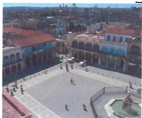
SAN ANTONIO DE LOS BAÑOS será o adversário deste ano