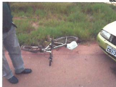
ADOLESCENTE morreu após ser atingido por um carro