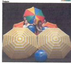
MUSICAL será apresentado em mais dez cidades do Paraná