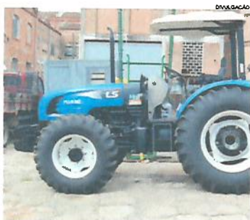
Cidades Página A4

Com verba oriunda do Ministério da Agricultura, Pecuária e Abastecimento, a prefeitura de Jaguariaíva realizou licitação para aquisição de máquinas agrícolas a serem utilizadas pela secretaria municipal de Agropecuária e Meio Ambiente (SAMA). O investimento global foi de R$ 163 mil, sendo R$ 145 mil do governo Federal e contrapartida municipal no valor de R$ 17,5 mil e as máquinas e equipamentos já se encontram no município.