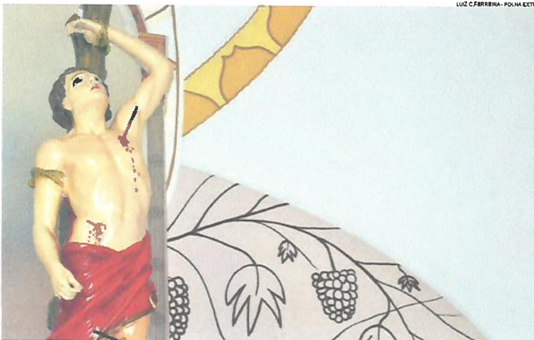
LUZ C FERRIRA - FOLHA EXTRA