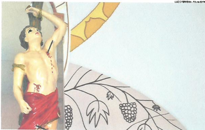
LUIZ C. FERREIRA - FOLHA EXTRA