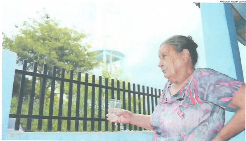
ARQUIVO: FOLHA EXTRA

Dois dos municípios com maiores problemas no que diz respeito à coleta de esgoto e fornecimento de água vivem a expectativa de ter estes problemas solucionados. Ou ao menos amenizados. Wenceslau Braz e Ibaiti estão entre os municípios paranaenses com projetos na área do saneamento básico que podem ser financiados pelo governo federal. Destaques Página A8