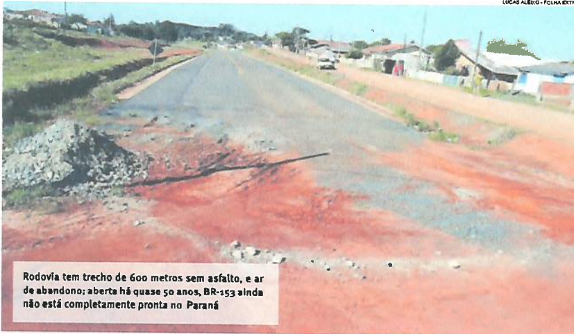
LUCAO ALEIXO - FOLHA EXTRA

O aspecto de “rodovia fantasma” na BR-153 em Ventania, nos Campos Gerais, pode estar prestes e ser transformado após quase 50 anos de espera. O asfalto entre o município e Tibagi chegou finalmente em 2008, mas um trecho de apenas 600 metros, no perímetro urbano de Ventania, continuou sem pavimentação, já que uma vila havia se formado naquele local e a prefeitura precisou realocar os moradores. Assim, mesmo pronto, o trajeto de mais de 40 quilômetros parece nunca ter sido inaugurado e segue com movimento aquém do esperado. Agora, a rodovia pode finalmente ter este trajeto completo. Destaques Página A6