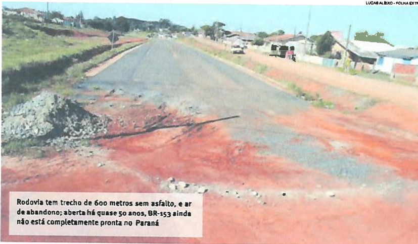
LUCAS ALBINO - FOLHA EXTRA

O aspecto de “rodovia fantasma” na BR-153 em Ventania, nos Campos Gerais, pode estar prestes e ser transformado após quase 50 anos de espera. O asfalto entre o município e Tibagi chegou finalmente em 2008, mas um trecho de apenas 600 metros, no perímetro urbano de Ventania, continuou sem pavimentação, já que uma vila havia se formado naquele local e a prefeitura precisou realocar os moradores. Assim, mesmo pronto, o trajeto de mais de 40 quilômetros parece nunca ter sido inaugurado e segue com movimento aquém do esperado. Agora, a rodovia pode finalmente ter este trajeto completo. Destaques Página A6