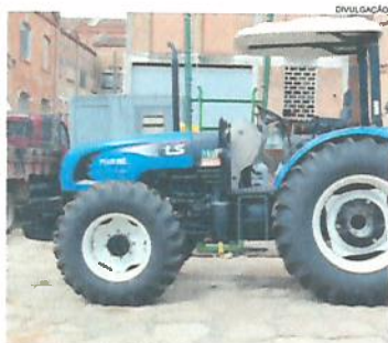
Cidades Página A4

Com verba oriunda do Ministério da Agricultura, Pecuária e Abastecimento, a prefeitura de Jaguariaíva realizou licitação para aquisição de máquinas agrícolas a serem utilizadas pela secretaria municipal de Agropecuária e Meio Ambiente (SAMA). O investimento global foi de R$ 163 mil, sendo R$ 145 mil do governo Federal e contrapartida municipal no valor de R$ 17,5 mil e as máquinas e equipamentos já se encontram no município.