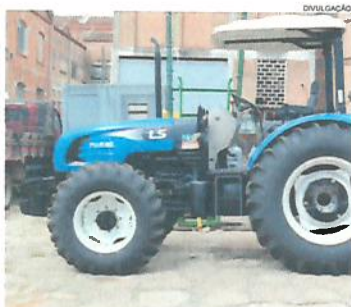
Cidades Página A4

Com verba oriunda do Ministério da Agricultura, Pecuária e Abastecimento, a prefeitura de Jaguariaíva realizou licitação para aquisição de máquinas agrícolas a serem utilizadas pela secretaria municipal de Agropecuária e Meio Ambiente (SAMA). O investimento global foi de R$ 163 mil, sendo R$ 145 mil do governo Federal e contrapartida municipal no valor de R$ 17,5 mil e as máquinas e equipamentos já se encontram no município.