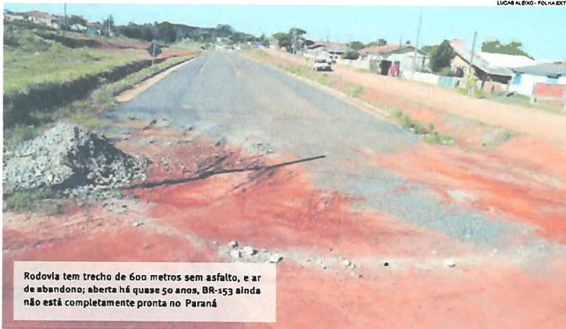
Rodovia tem trecho de 600 metros sem asfalto, e ar de abandono; aberta há quase 50 anos, BR-153 ainda não está completamente pronta no Paraná

O aspecto de “rodovia fantasma” na BR-153 em Ventania, nos Campos Gerais, pode estar prestes e ser transformado após quase 50 anos de espera. O asfalto entre o município e Tibagi chegou finalmente em 2008, mas um trecho de apenas 600 metros, no perímetro urbano de Ventania, continuou sem pavimentação, já que uma vila havia se formado naquele local e a prefeitura precisou realocar os moradores. Assim, mesmo pronto, o trajeto de mais de 40 quilômetros parece nunca ter sido inaugurado e segue com movimento aquém do esperado. Agora, a rodovia pode finalmente ter este trajeto completo. Destques Página A6