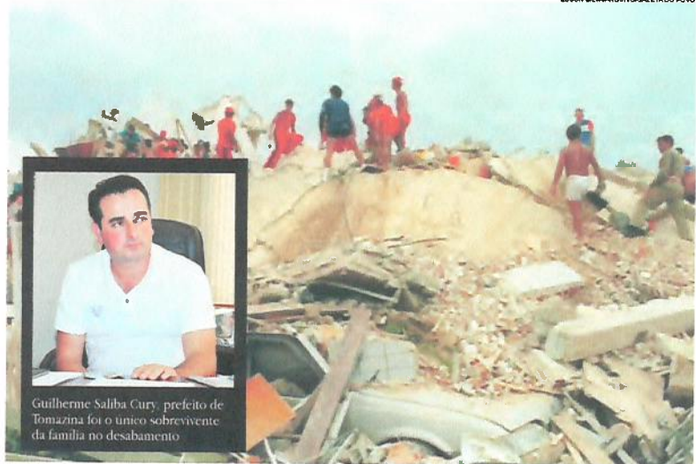
Guilherme Saliba Cury, prefeito de Tomazina foi o único sobrevivente da família no desabamento