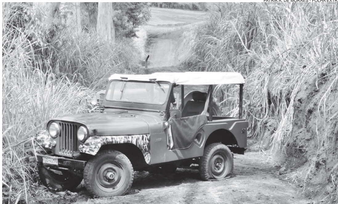
Jeep e trator impediam tráfego na estrada

A situação piorou nos últimos dias quando a prefeitura de Santana refez o trajeto original da estrada, uma vez que o anterior tinha minas de água que