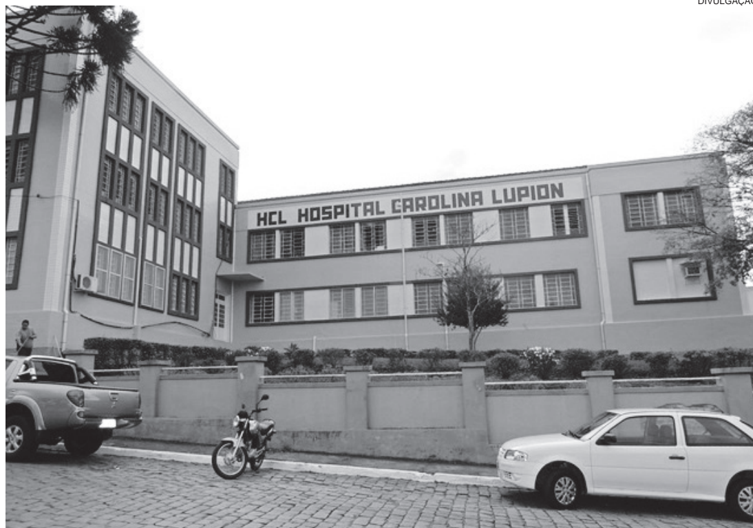
Hospital, que é municipal, ganhará mais uma melhoria

Também serão instaladas telhas de fibra de cimento e estrutura metálica, prevendo maior durabilidade, substituição de calhas e rufos, bem como da instalação elétrica e hidráulica. Visando não prejudicar o atendimento